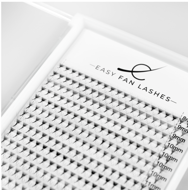
Kępki EASY FAN